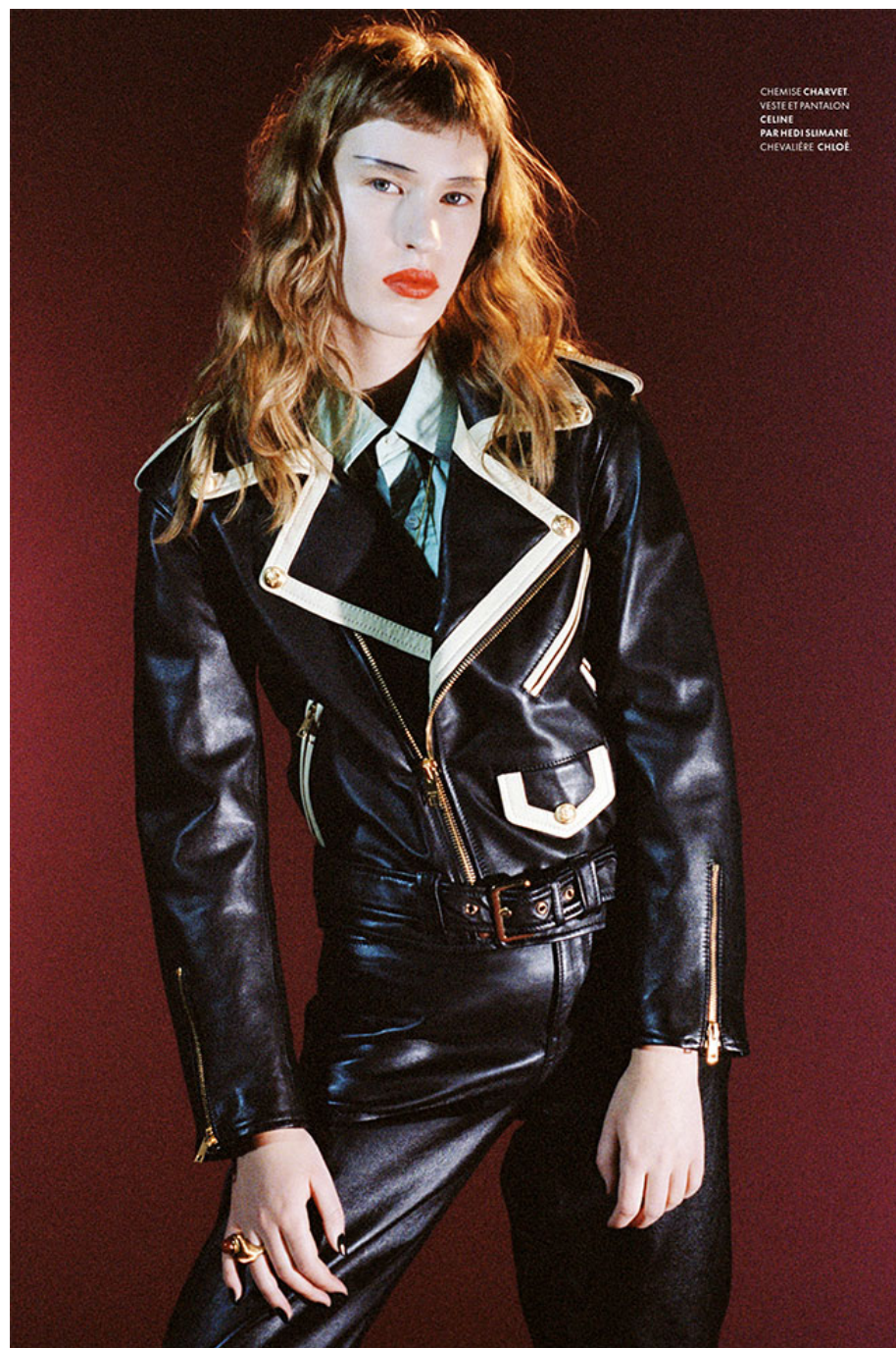
CHEMISE CHARVET VESTE ET PANTALON CELINE PAR HEDI SLMANE CHEVALIERE CHLOE