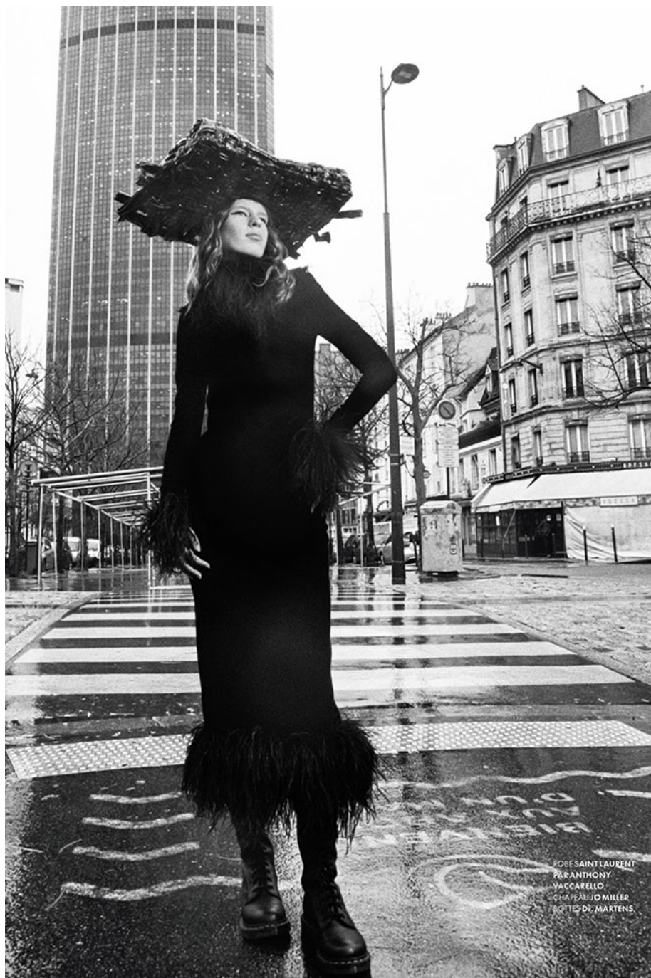
ROBE SAINT LAURENT PAR ANTHONY VACCARELLO CHAPEAU JO MILLER BOITES DE MARIENS