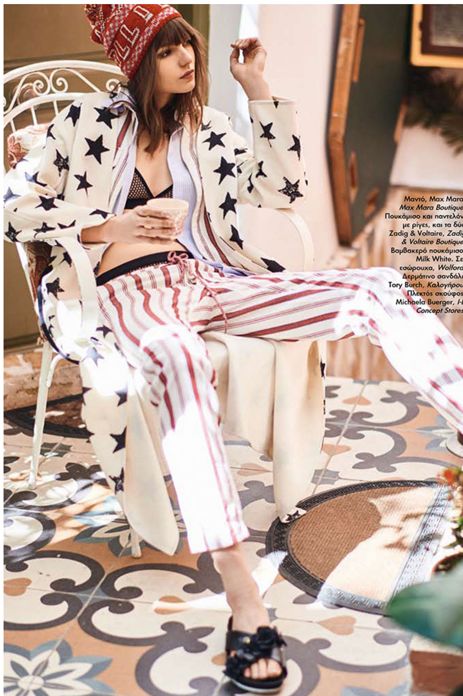
Μαντό, Max Mara, Max Mara Boutique. Πουκάμισο και παντελόνι με ρίγες, και τα δύο Zadig & Voltaire, Zadig & Voltaire Boutique. Βαμβακερό πουκάμισο, Milk White. Στ σαΐρουκα, Walford. Δερμάτινο σανδάλι, Tory Burch, Καλογύριου. Πλεκτός σκούφος, Michaela Buegger, I-D Concept Stores.