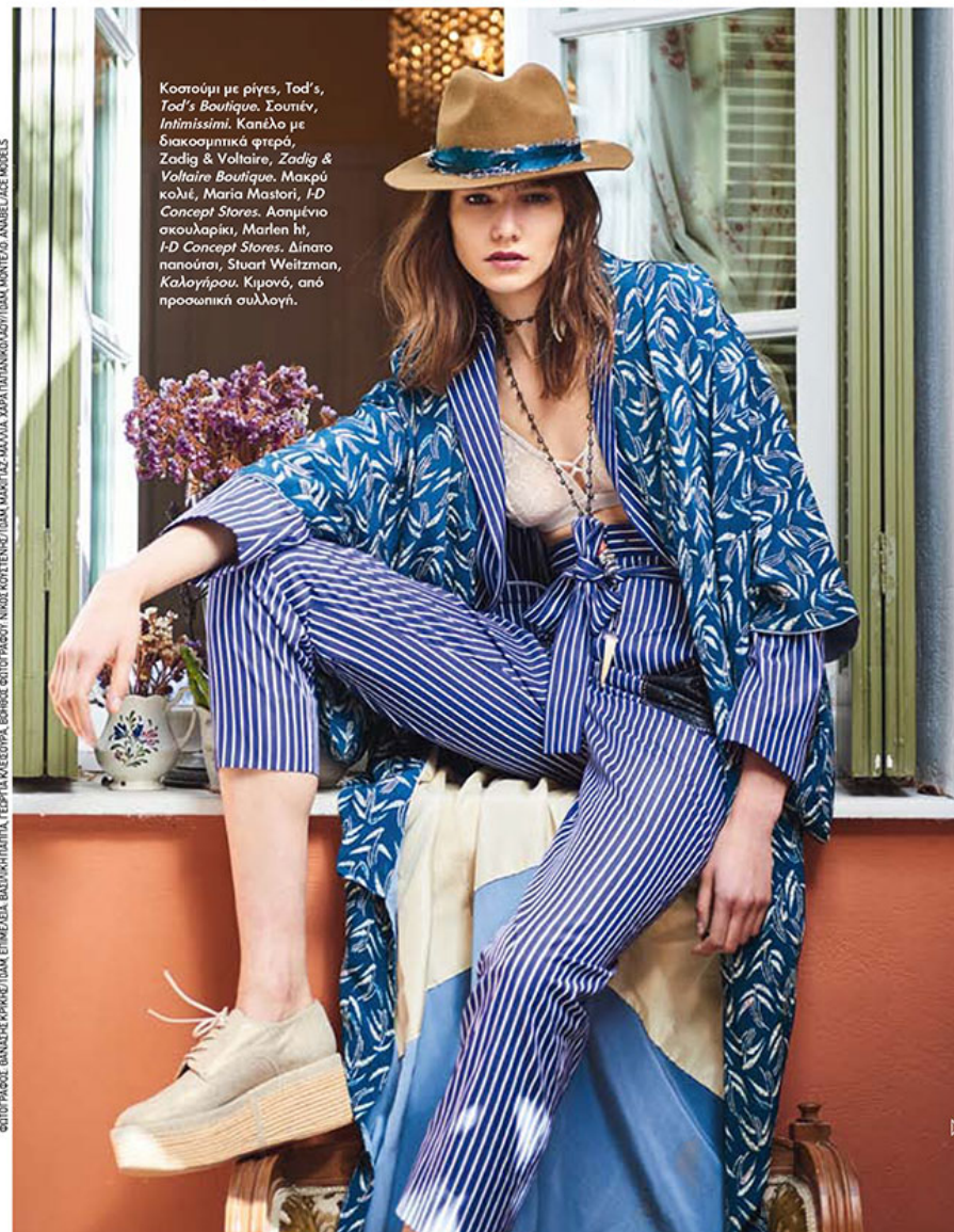
Κοστούμι με ρίγες, Tod's, Tod's Boutique, Σουπέν, Intimissimi. Καπέλο με διακοσμητικά φτερά, Zadig & Voltaire, Zadig & Voltaire Boutique. Μακρύ κολιέ, Maria Mastori, I-D Concept Stores. Ασπρίνιο σκουλαρικό, Marlen It, I-D Concept Stores. Δίπλα παπούτσια, Stuart Weitzman, Καλογήρου. Κιμονό, από προσωπική συλλογή.

ΦΩΤΟΓΡΑΦΕΣ: ΘΑΝΑΣΗΣ ΚΡΗΜΗΤΣΙΔΗΣ, ΕΠΙΜΕΛΕΙΑ: ΒΑΣΙΛΙΚΗ ΠΑΠΑΤΩΝ, ΕΚΔΟΣΗ: ΓΕΩΡΓΙΑ ΜΑΞΕΩΝΑ, ΒΟΗΘΟΣ ΦΩΤΟΓΡΑΦΟΥ: ΝΙΚΟΣ ΚΟΥΤΣΙΝΗΣ, ΎΣΙΑ: ΜΑΡΚΕΛΛΑ ΜΑΛΙΑ, ΔΩΡΑ ΠΑΠΑΝΙΚΟΛΑΟΥ/ΎΣΙΑ ΜΟΝΤΕΡΟ, ΑΝΔΡΕΑΣ ΜΟΝΤΕΡΟ