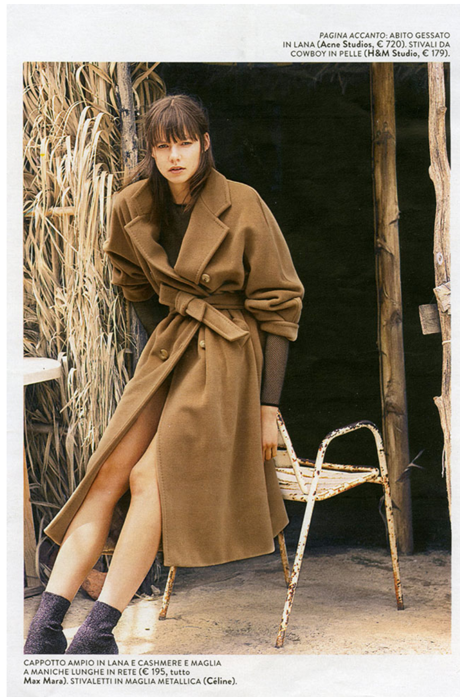
PAGINA ACCANTO: ABITO GESSATO IN LANA (Acne Studios, € 720). STIVALI DA COWBOY IN PELLE (H&M Studio, € 179).