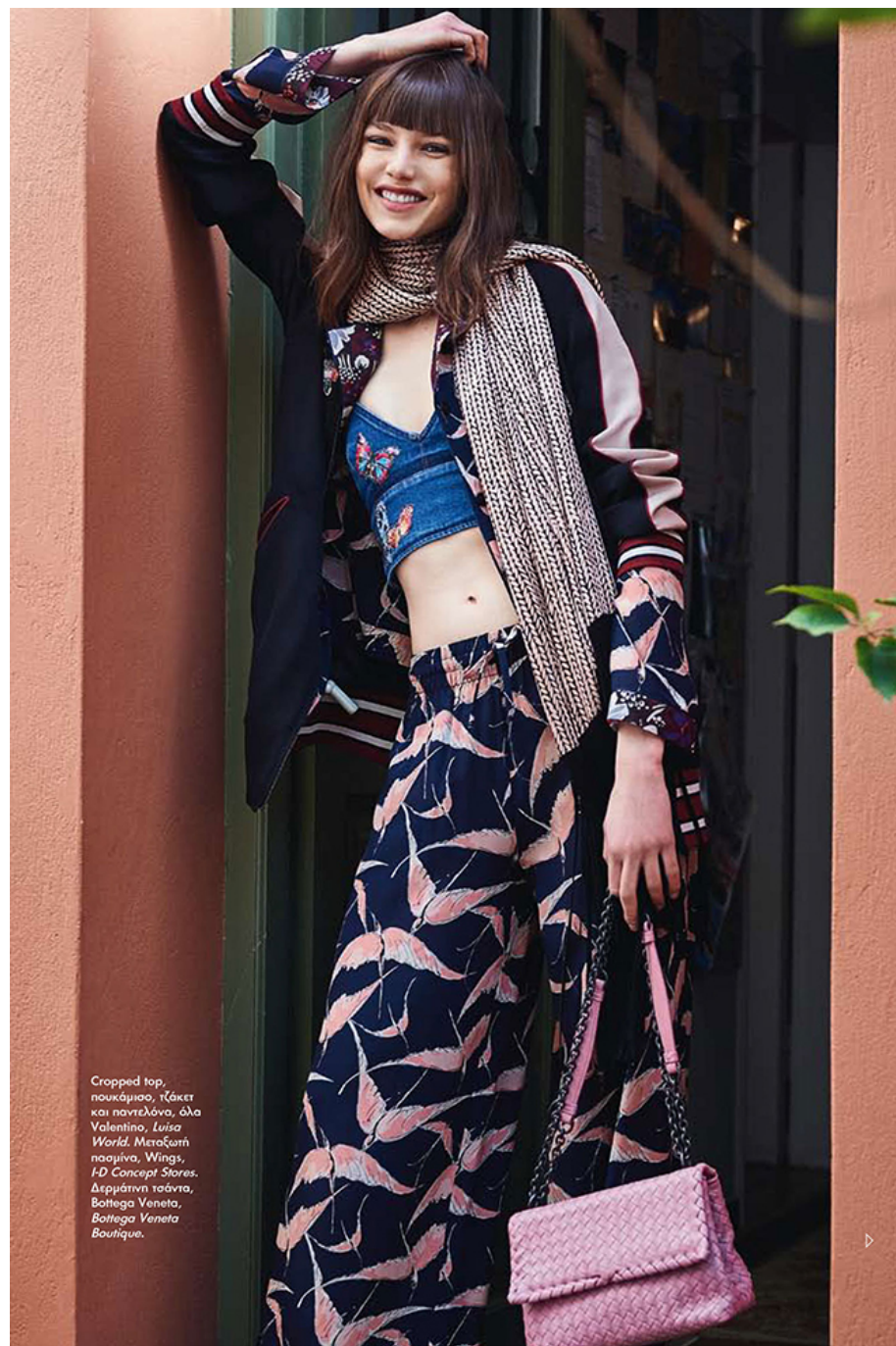
Cropped top, πουκάμισο, τζάκιτ και παντελόνι, όλα Valentino, Luisa World. Μεταξινή σαβίνα, Wings, I-D Concept Stores. Δερμάτινη τσάντα, Bottega Veneta, Bottega Veneta Boutique.